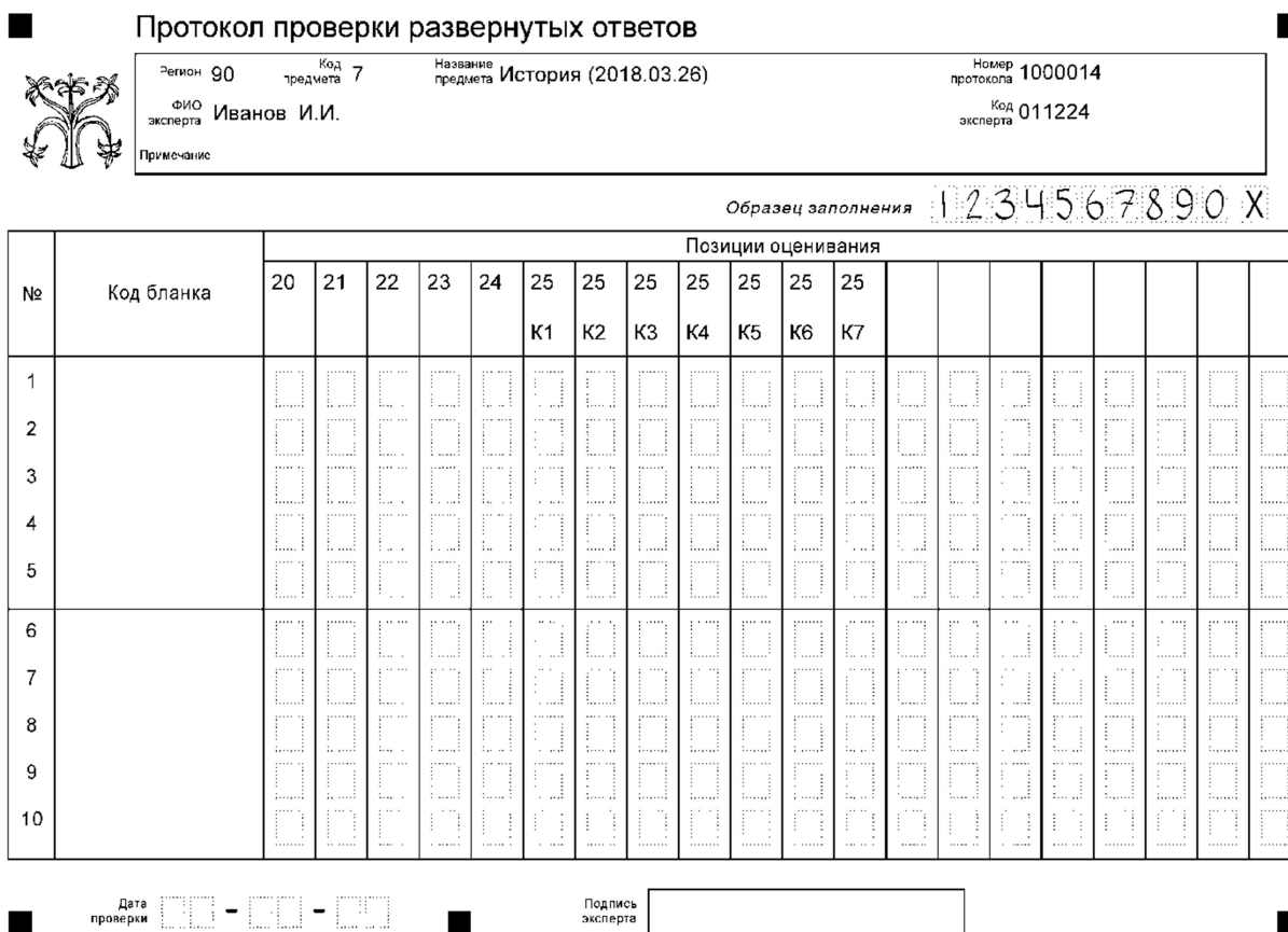
Рисунок 1. Протокол проверки развернутых ответов. Образец

При оценивании заданий с развернутым ответом эксперт должен помнить о том, что: